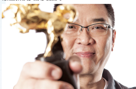
赵薇 × 关锦鹏