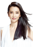
李冰冰·金马随感: 我在台北,朝十晚九

● 颁发最佳影片:李安 × 侯孝贤 ● 颁发最佳男主角:林青霞 × 刘青云 ● 颁发最佳剧本:陈可辛 × 许鞍华 ● 颁发终身成就奖:秦祥林