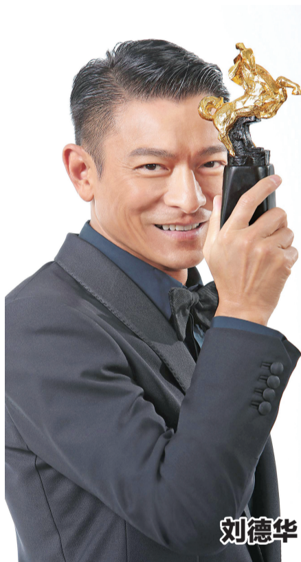
刘德华 × 张曼玉