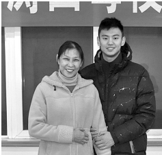
宁泽涛和启蒙教练郭红岩