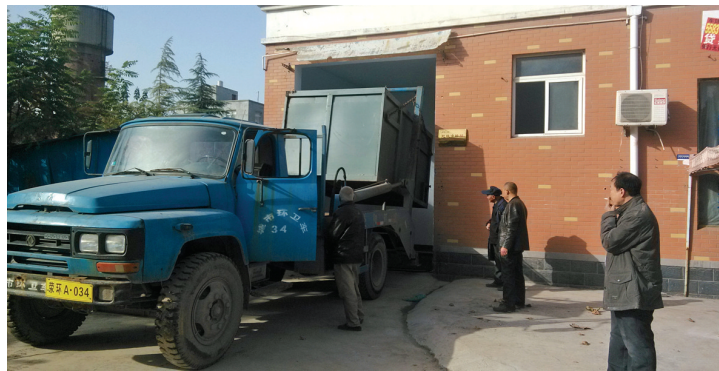
环卫工正向垃圾中转站倒垃圾

11月15日开始,荥阳市京城大街上的垃圾中转站和公共卫生间经过装修,重新对外开放,投入使用。