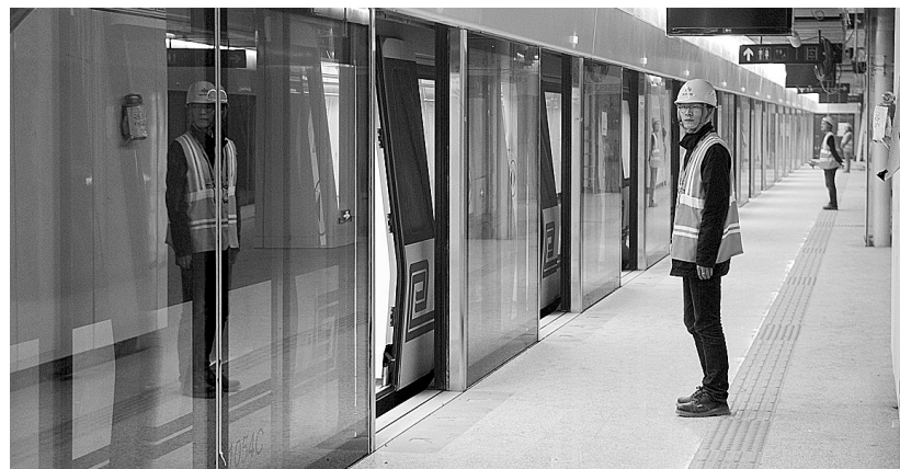
地铁的站务员已经培训到位,准备好为乘客提供服务。