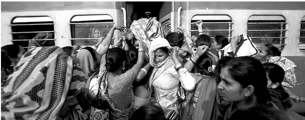
为了让女性在乘车时感到更安全，印度火车开设了女性专用车厢，但几乎没有效果。

据外媒25日报道，当地时间23日午夜，印度93名女学生在从东部巴特那开往丹巴德的一列火车上集体遭到性骚扰，时间长达4个多小时。整个过程中，车上的乘客和列车员无人伸出援手。