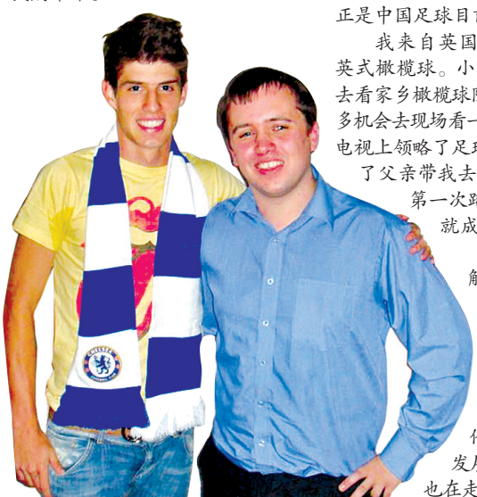
阿特金斯(右)和巴西球员皮亚松(目前被切尔西租借至荷甲维特斯)。

月收入比多数中国记者至少高一倍。“现在生活没问题。我正在努力挣钱,为了我的未来。”