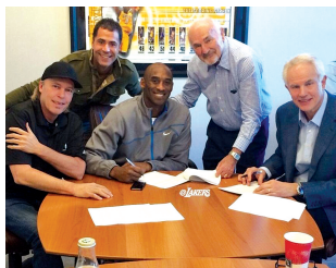
科比在个人推特上贴出了续约现场照片

两年4850万美元,NBA洛杉矶湖人队留下了当家球星科比,他们的合同将延续到2016年夏天,届时,科比将达到38岁“高龄”,他为湖人队效力的时间也将长达20年。