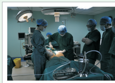
图3: 员工做360°海洋柔动力吸脂现场