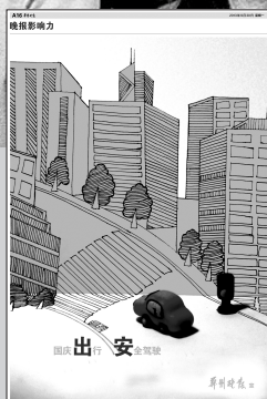
《郑州晚报》入选作品之一