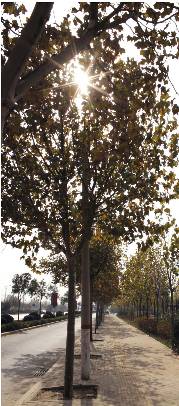
在郑州西南部打造一个生态宜居的生态文化区。

对此,二七新城管委会负责人认为,经济发展与文明发育是互为动力的,是相辅相成的。二七新城的建设就是要深度挖掘文化内涵,要助力增势,让文化彰显品格,让文化更加惠民。