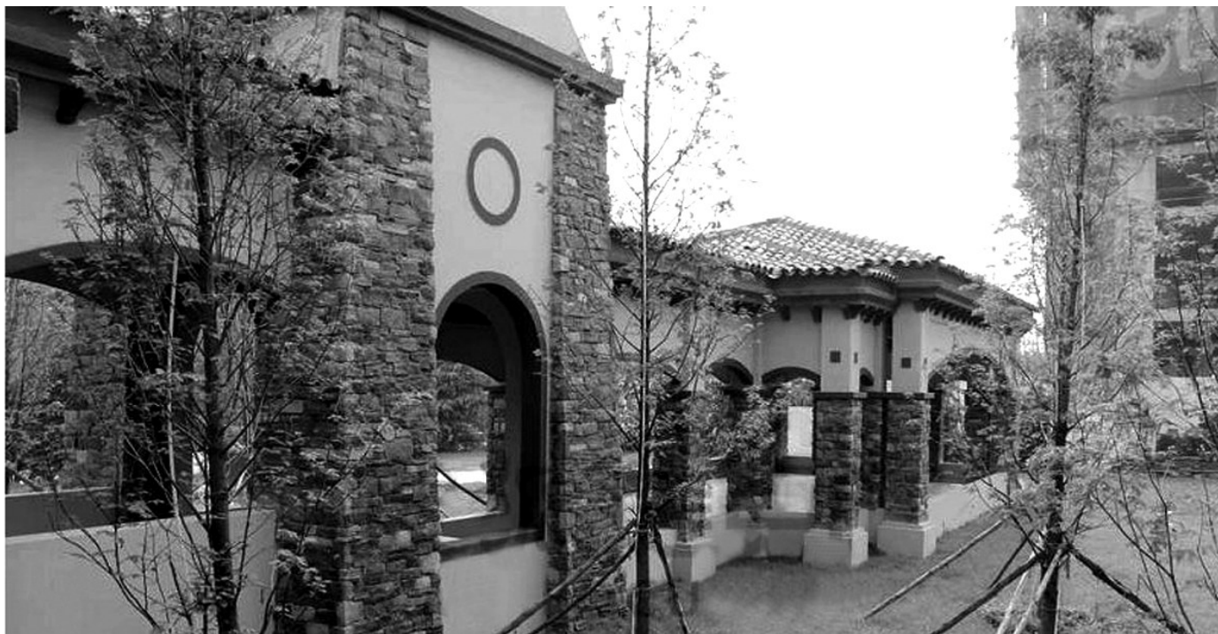
“郑上新区”的横空出世,让置业者看好大西区(图为清华·大溪地实景)