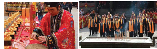
关帝祖庙开光现场 两岸名流政要出席开光仪式

关公金玉宝玺便上香叩拜,我一生尊崇关公的忠义仁勇,做人做事。《关圣帝君宝玺》我自己留 2 套,余下的赠送给商业伙伴,我们一起兴旺发达,一帆风顺!