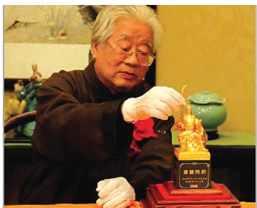
袁广如 中国特级工艺美术大师