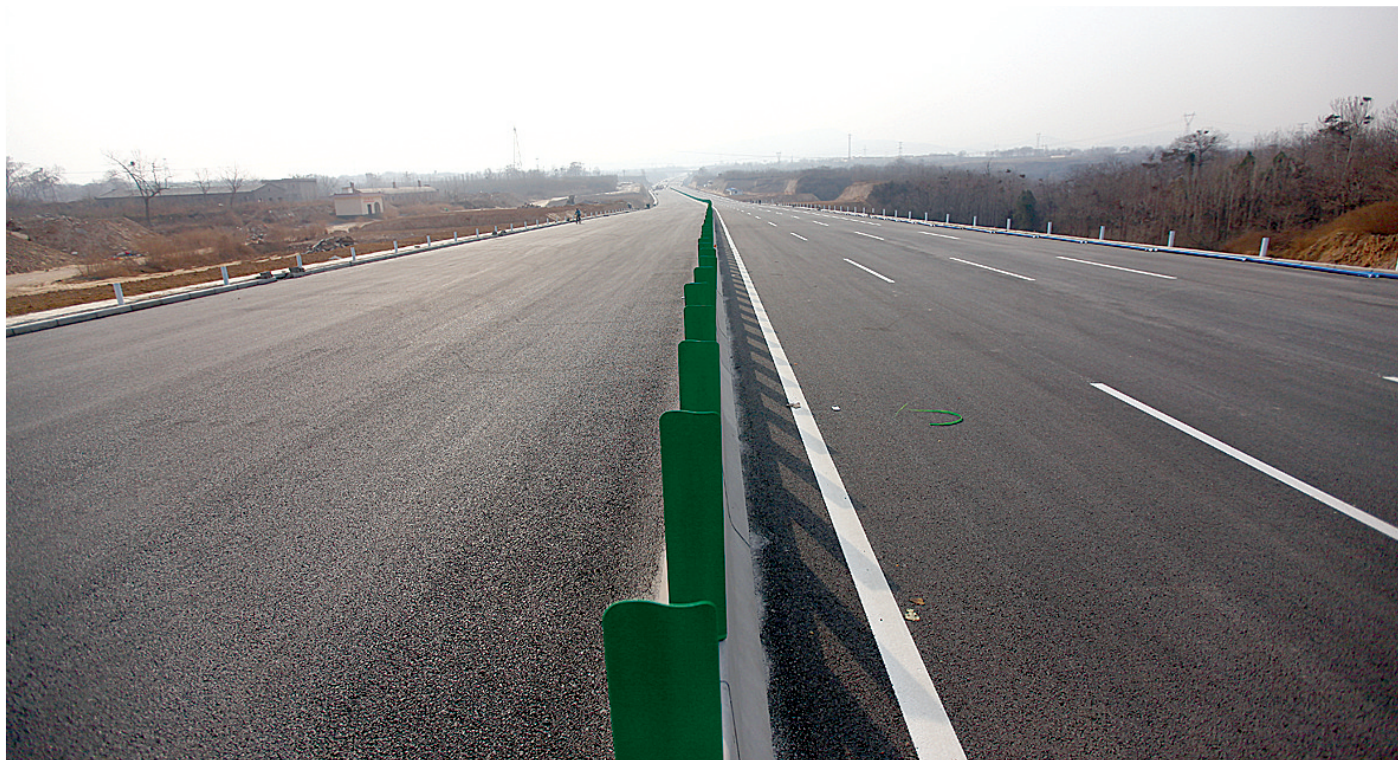
郑上快速路工程建设已进入收尾阶段。

作为连接中心城区和上街区的一条交通大动脉,2012年6月开工的郑州至上街快速通道新建工程目前已进入收尾阶段,26日将正式竣工通车。届时,从市区到上街,原本半个小时的车程将缩短到十几分钟。 郑州晚报记者 马燕 实习生 王之宇 文/图