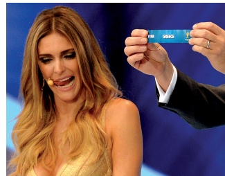
千娇百媚的主持人