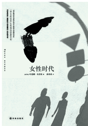
《女性时代》,(俄)叶莲娜·奇若娃著,薛冉冉译,译林出版社2013年9月版。