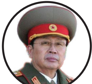
张成泽被开除党籍