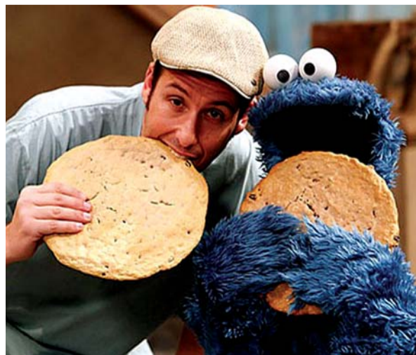
喜剧明星亚当·桑德勒