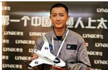
韩庚明年将上太空。