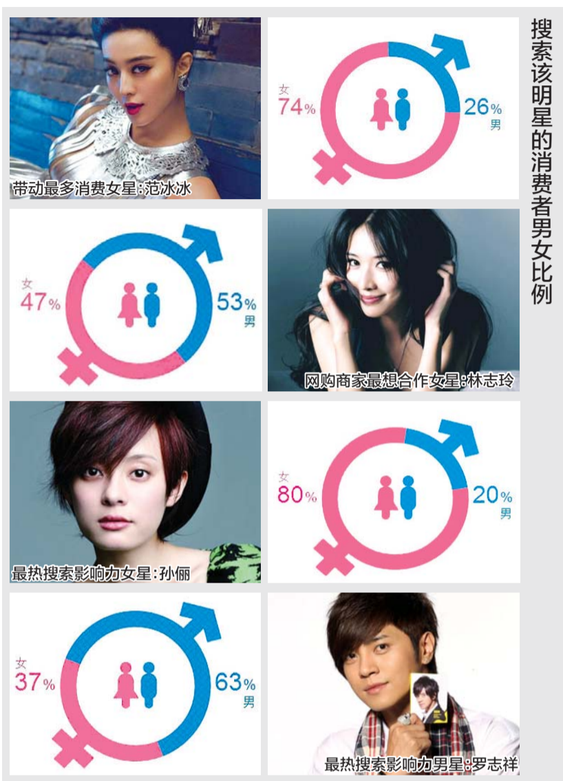
搜索该明星的消费者男女比例

但范爷就更加威武了,除了普通穿戴和打扮外,她对充气娃娃的销售居然也起着重要作用,在该网提供的榜单数据上,“充气娃娃”以4.39%的比例位居范爷所影响的产品类别第六位。