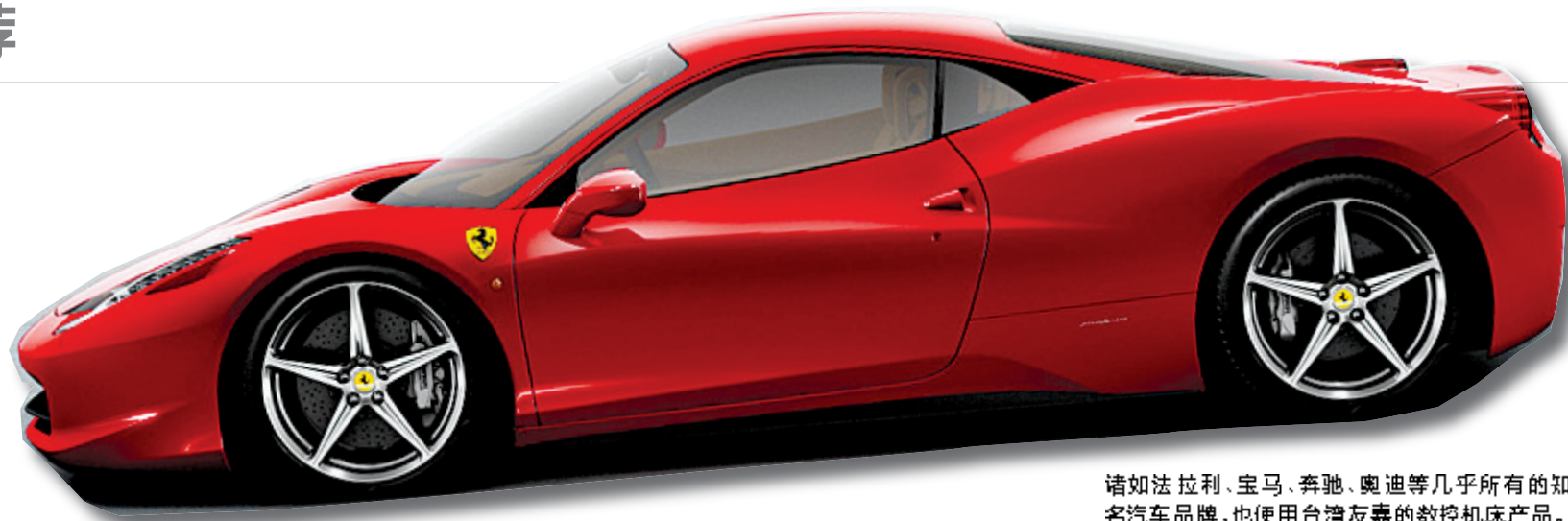
诸如法拉利、宝马、奔驰、奥迪等几乎所有的知名汽车品牌,也使用台湾友嘉的数控机床产品。