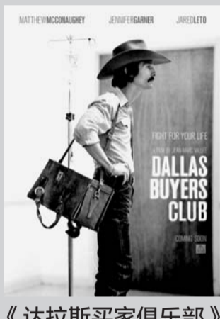
《达拉斯买家俱乐部》