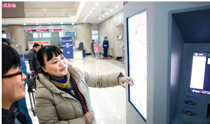
新媒体公共服务智能终端功能强大,吸引了不少市民的关注。