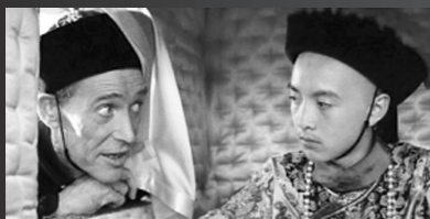
彼得·奥图在大银幕上与国人的第一次“见面”，应是在1987年拍摄的《末代皇帝》中饰演溥仪的老师庄士敦。