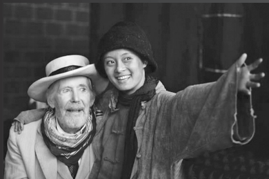
2007年，孙俪因拍摄电影《金山》与奥图合作。她在微博上传了当年的合照，并回忆道：“那年他77岁，眼睛很蓝很纯净，为人绅士。”