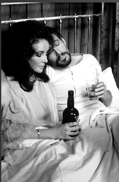
↑奥图与好莱坞巨星的合作，更是一抓一大把，他曾与伊丽莎白·泰勒在《牛奶树下》中合作，和赫本则合作过《偷龙转凤》。