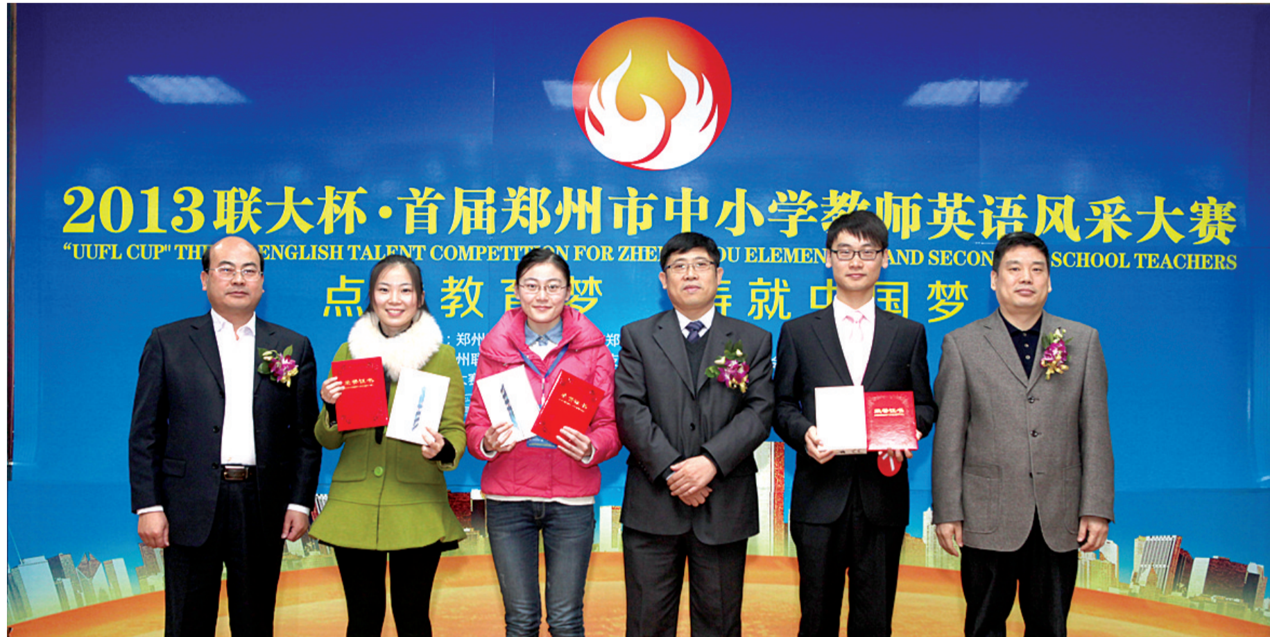
三个特等奖选手合影