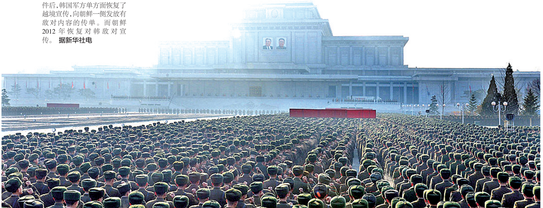
宣誓向金正恩效忠