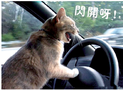
闪开呀,咱早人来轰