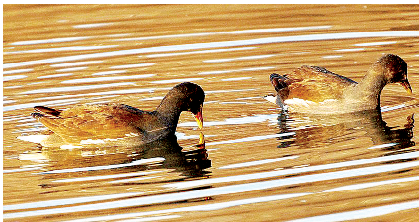
两只水鸟在湖面觅食,模样酷似,动作一致,趣味横生。