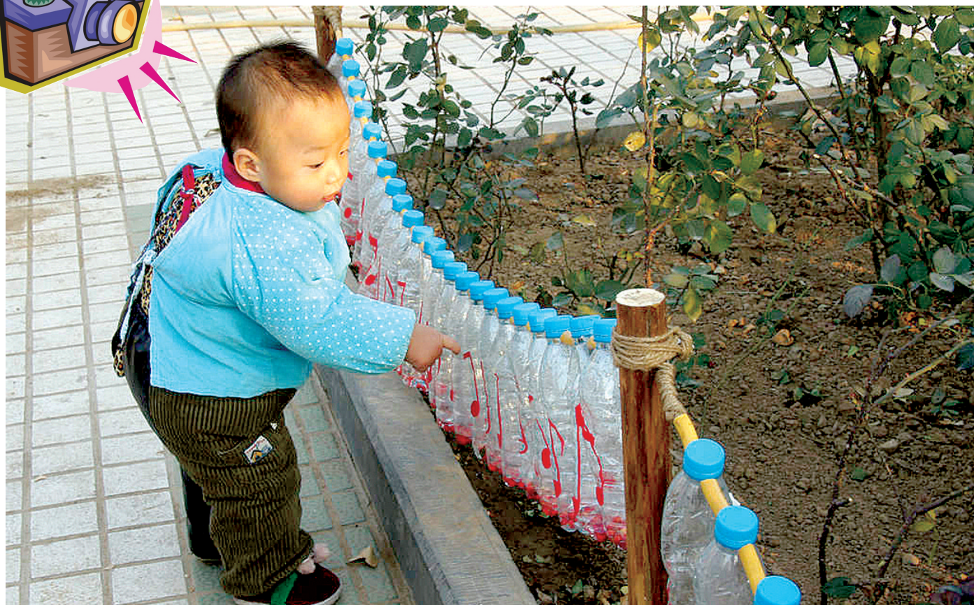
小乐手 一名小朋友上前拨动。 市民记者 徐嘉旭 拍摄地点: 文博广场