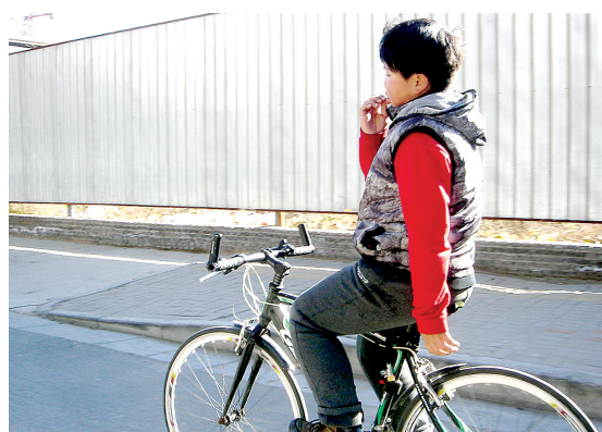
拍摄地点:文博广场 一名澳大利亚女士正在跟市民学太极拳,一招一式,非常投入。