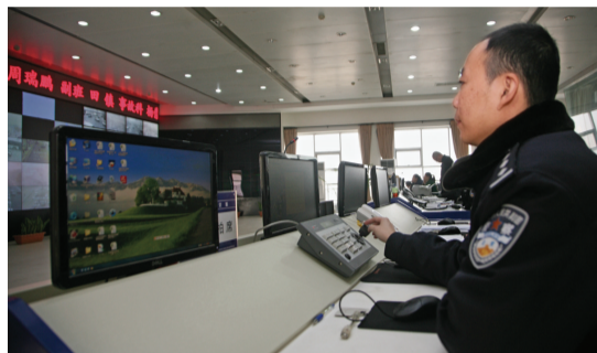
交警支队民警通过360°摄像头抓拍违章车辆。

下一步，结合郑州市道路建设情况，在已建成的智能交通系统框架的基础上，进行陇海快速路智能交通和郑东新区智能交通建设，主要包括对“一个中心”、“两个平台”、“十大系统”的进一步结合和完善，计划投资约1亿元。