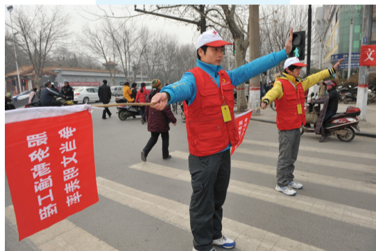
志愿者街头协助交警疏导车辆，维持交通秩序。