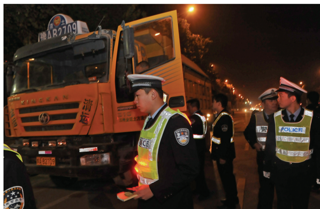
交巡警九大队民警夜查渣土车。