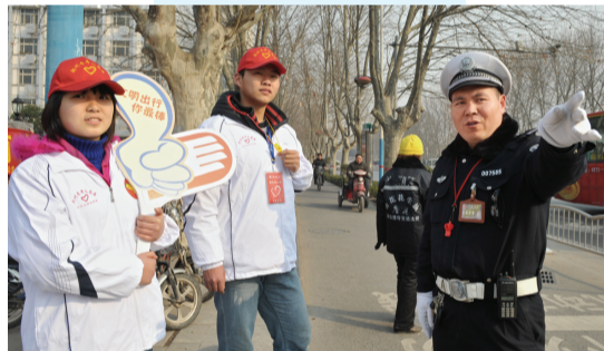
交警向志愿者介绍路口车流情况。