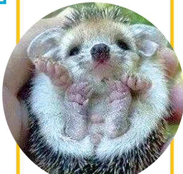
刚刚出生的萌刺猬,是否萌翻了你的心?