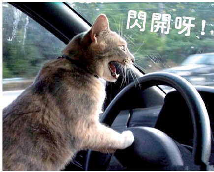
闪开呀,喵星人来袭