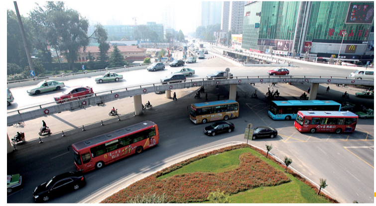
二七广场和紫荆山区域公交站名采用地标名加道路名进行升级