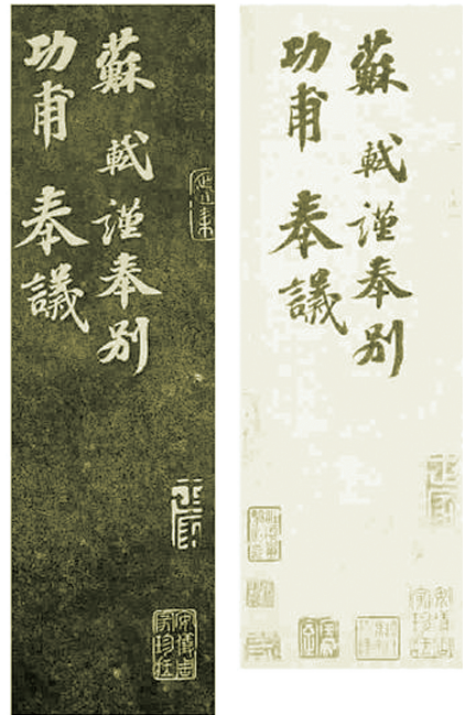
《安素轩石刻》中的苏轼《功甫帖》拓本(左)、《功甫帖》钩摹本(右)。

研究员们认为,书法是笔墨与纸张的关系,石刻则是刀、石关系;刻工有高下,拓本之好坏又涉及拓工、装裱的名家与否。总之,诸多不确定因素的叠加造成了石刻及其拓本自身的局限与特点,即无法达到书家自然书写时的浑然天成,比如“牵丝”、“飞白”等。此件《功甫帖》钩摹本还是从石刻拓本中钩摹出,而非原作钩摹,书艺自然差之千里。