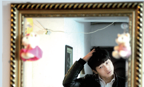
出门前总会在镜子前修饰一番。