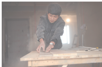
切割机一响，满屋的粉尘让人无法睁眼。