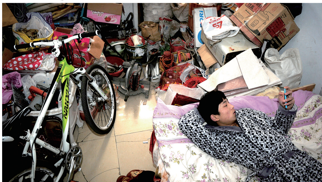
摆满杂物的房间掩饰不住对生活品质的追求。