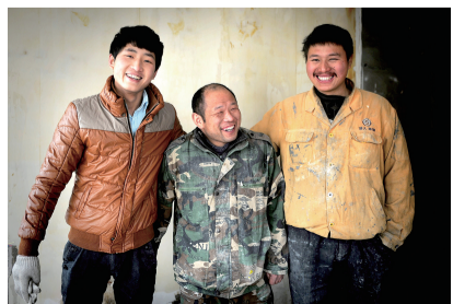
90后男孩的身影在工友之间很特别。