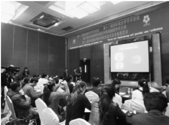
美国麦迪格专家丹尼·贝尔先生在第十二届国际眼科年会上讲述非手术近视矫治技术，该项技术引起了现场数百位中外眼科专家的广泛关注

交流会期间，美国麦迪格专家丹尼·贝尔带来的麦迪格塑形组合原理及检测技术，得到了现场专家的阵阵掌声，会后众多眼科医院均对该项技术表示出浓厚的兴趣，但据丹尼·贝尔先生介绍，因该技术对售后服务要求较高，所以暂时只通过麦迪格200多家视光中心进行推广，短期内这种产品只能在麦迪格才能购买到。