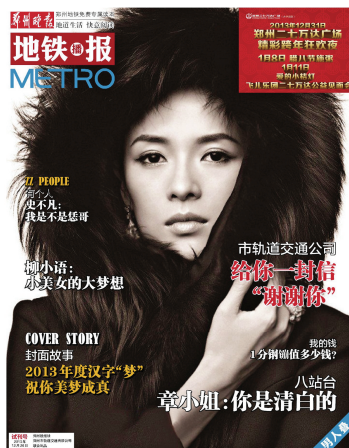
他的她上了“男人叠”封面