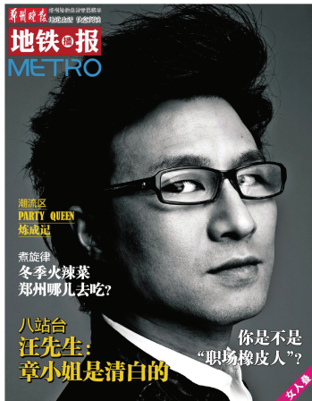
他上了“女人叠”封面

“希望地铁1号线能够向西再延伸一些,现在西四环那边公交和打车都非常不方便,如果地铁能够开通到那里,我们的出行会快捷得多。” 郑州晚报记者 吴淑娟 见习记者 叶霖