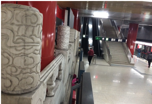
北京地铁雍和宫站