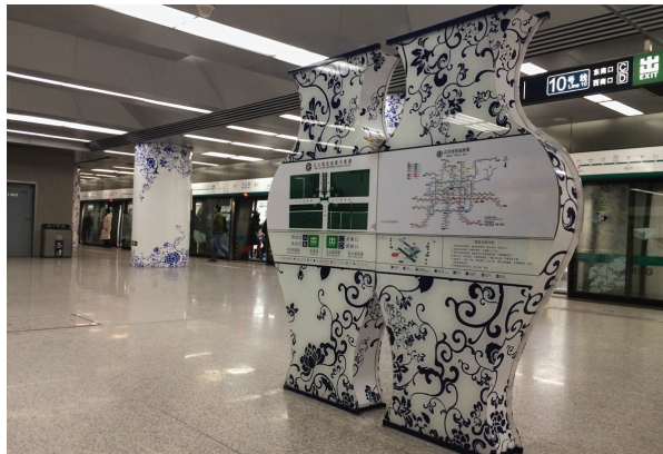
北京地铁站台构造青花瓷造型