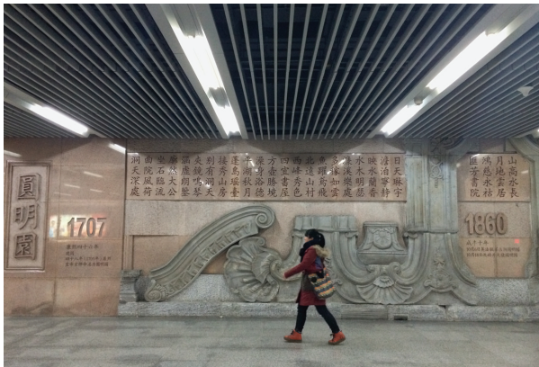
北京地铁站台构造圆明园造型