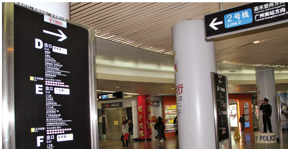
广州公元前站出口示意图