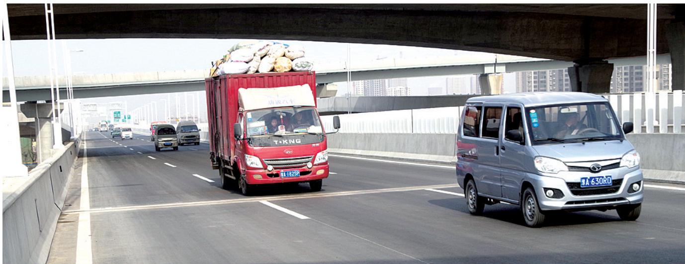
禁行的大货车在三环快速路上行驶

昨日,郑州晚报记者驱车从南三环中州大道附近赶至北三环花园路,只用了短短23分钟,在获得久违的驾驶快感的同时,也发现三环快速路高架桥上一些问题初露端倪。对此,交巡警支队科研所郭睿表示,三环快速路并不是真正意义上的正式开通,桥下还在施工中,它目前只是一条施工保通路。郑州晚报记者 刘凌智 汪永森 实习生 董婧文/图