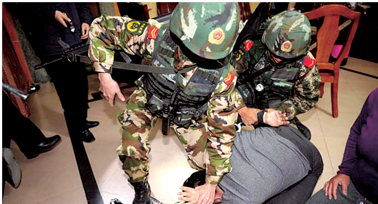
警方抓获犯罪嫌疑人

村里两成家庭制毒 村民配手雷 AK47 抗法 村支书是“带头大哥”，当地派出所充当“保护伞”