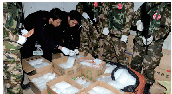
警方缴获大量毒品