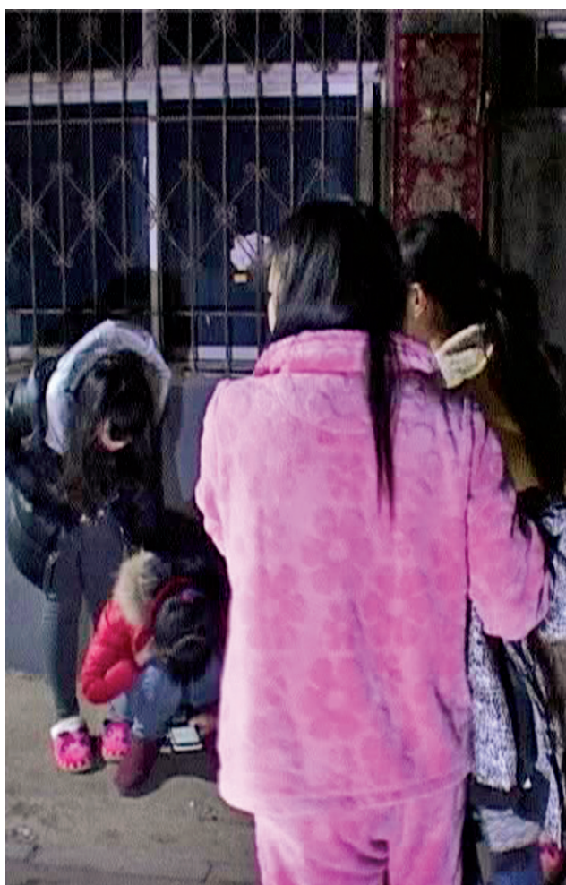
正洗澡的姐妹晕倒在地,其他打工妹也燃气中毒了

4日凌晨,代书胡同营门街一居民楼内,一名打工妹使用老式燃气热水器洗澡时,因通风不畅造成租住于此的8名打工妹集体燃气中毒,其中一人休克昏迷。