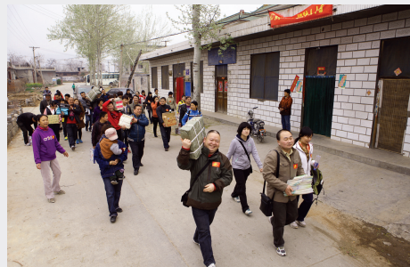
送书到山村 小钢炮摄影