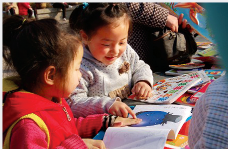
书店送来儿童大餐 温故知新摄影

小编说:每一次小记者投稿时,我们都会一再交代,要记得署名啊!要记得写学校啊!但几乎每一次都会有人忘掉这一项。于是,本次索性发出来一篇“佚名”的文章,和标有姓名的文章比起来,是不是感觉即使想赞叹“写得不错”,都不知道该夸谁。至于作者本人,想和小朋友炫耀的时候,你该怎样证明这是你写的呢?