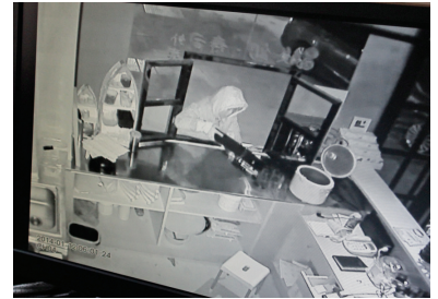
砸烂窗户后她爬了进去