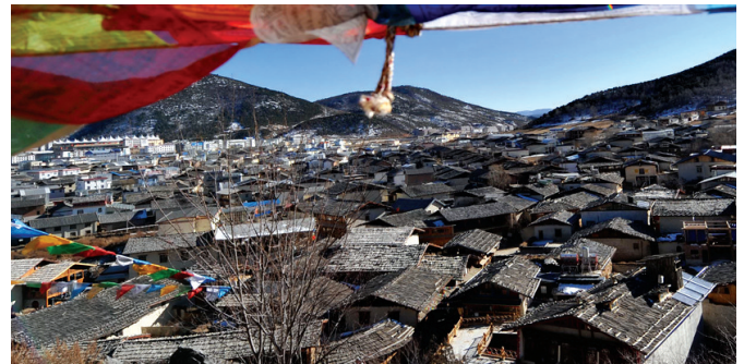
新闻链接 风光秀美的香格里拉位于云南省西北部,邻接四川省。“迪庆”藏语意为“吉祥如意的地方”,是世人早慕已久的世外桃源——“香格里拉”。