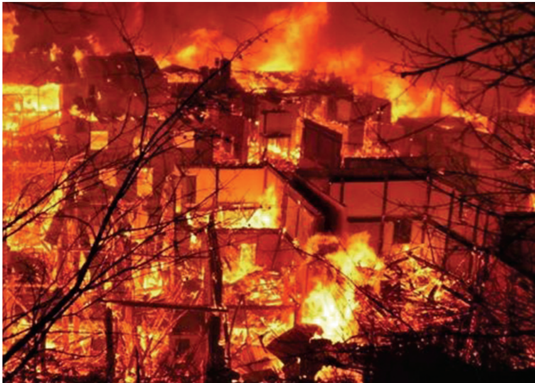
独克宗古城火灾现场