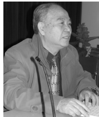
胡维勤教授谈“吃菜养心”疗法: 绿色安全,简单实用

作为普通老百姓,都想知道高层人士日常保健方式和治疗疾病的办法,近日,北京特级保健医师胡维勤教授,根据多年来多位高层领导的食疗菜谱,向广大心脑血管患者推荐“吃菜养心”的实用疗法,实现少吃药、不吃药防治心脑血管的愿望。目前,这一疗法已由北京康泰中医药研究院在全国普及推广。