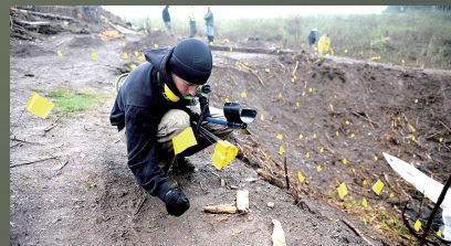
2012年5月2日,比利时,美军士兵在一处二战时期美军飞机坠毁的地点搜索遗骸。