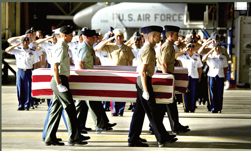
2011年12月9日,美国夏威夷岛,一名美军失踪人员的遗体正在被运走。