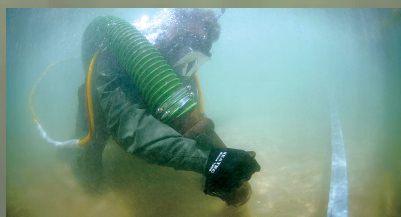
2011年5月20日,越南,JPAC的工作人员在水下用水枪冲击河床,寻找据称在此阵亡的美军士兵。