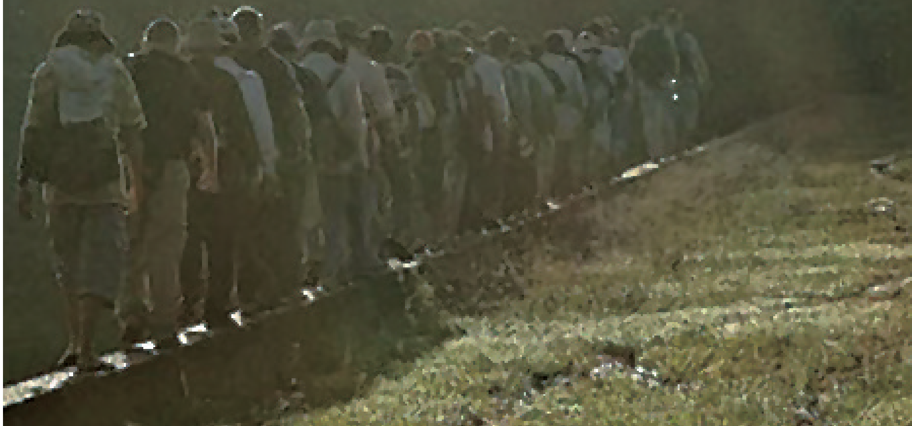
2011年,越南,JPAC的工作人员正前往一处越战中的美军坠机地点展开搜索。

当所有的鉴别程序结束后,JPAC的丧葬事务办公室会通知死者家属,之后,葬礼的程序就是:迁葬回国、举行军队葬礼仪式、存入国家档案。据《信息时报》