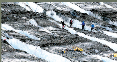
2012年1月25日,美国阿拉斯加,JPAC的工作人员在冰原上寻找一架失踪的C-47运输机。