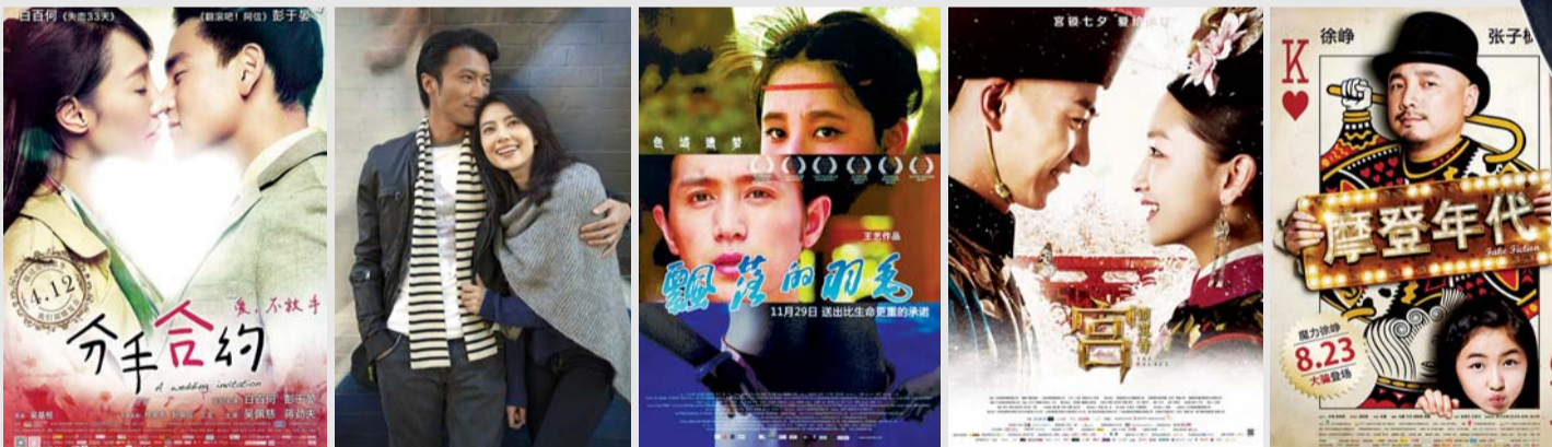
《分手合约》《一生一世》《飘落的羽毛》《宫锁沉香》《摩登年代》(从左至右)等片幸运被抽中。

2013年6月,两岸签署《海峡两岸服务贸易协议》,台湾将每年10部大陆片进口配额放宽至15部。但该协议目前尚在公听会及实质审查作业中,未正式生效。因此,2014年仍暂以10部为限。