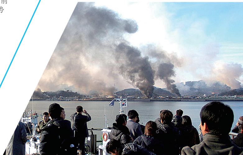
延坪岛炮击现场图(资料图片)