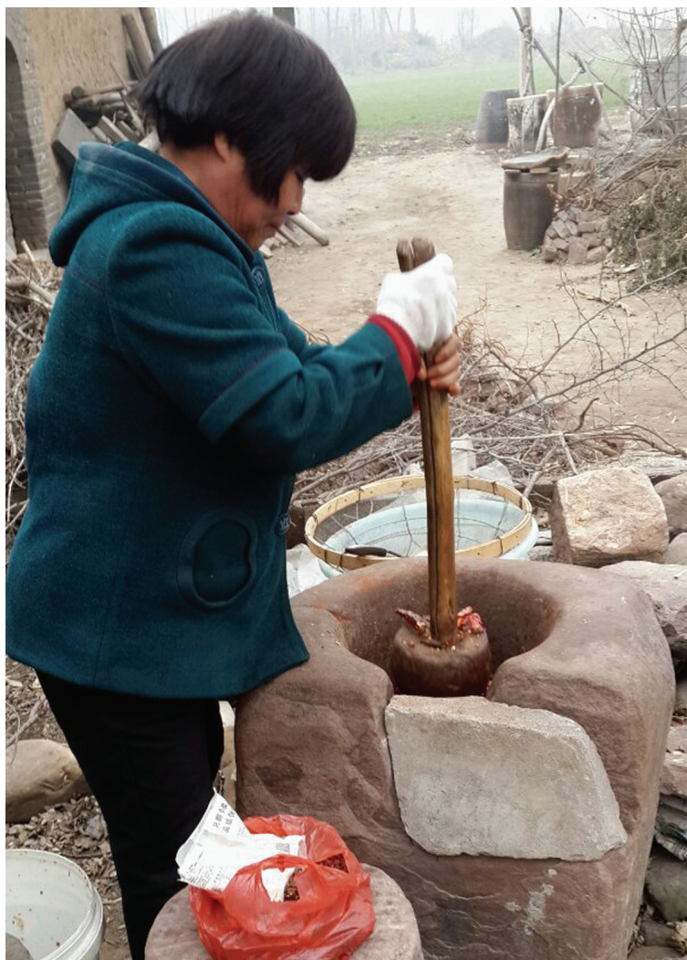
村民在用兑窑捣辣椒

炊烟袅袅的乡间,加工业的机械化让辣椒瞬间脱胎换骨,最终出落成红红的辣椒酱。随着社会的进步,动力机械迅速发展,粉碎机、磨面机等进入村庄,进入家庭。慢慢地闲置在家门口的石磨、兑窑、石碾成了历史的见证。