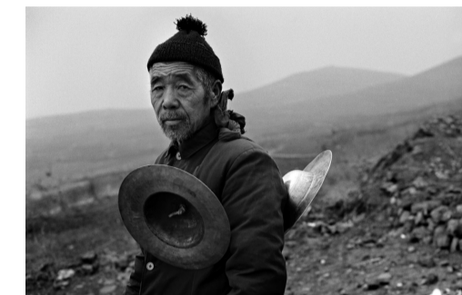
桐系列之·中原父老 1993 河南鲁山