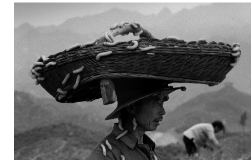
养蚕人 1987 河南鲁山