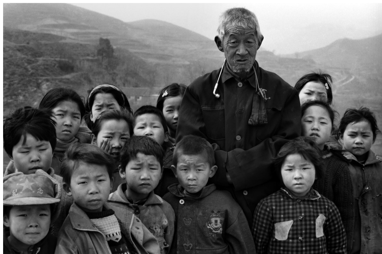
山村教师和他的学生们 1987 河南禹县