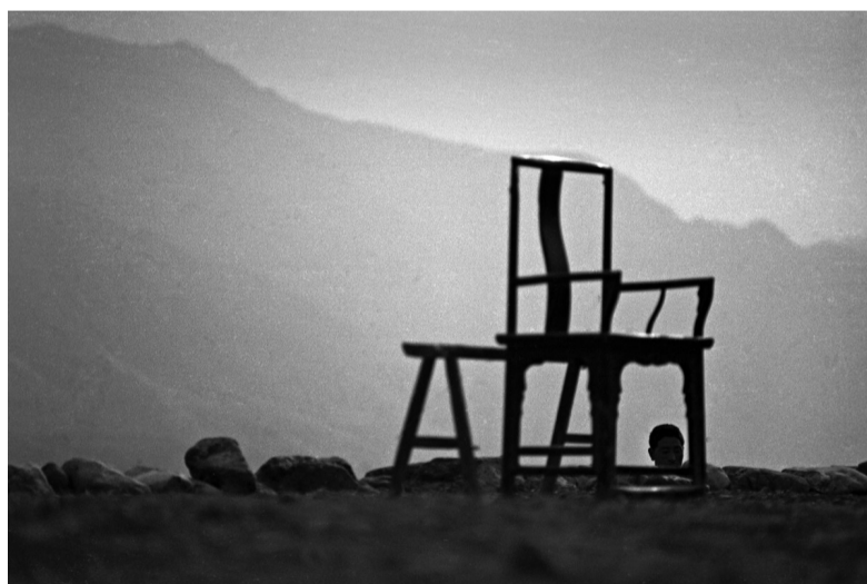
山杰·旧椅·戏台 1984 河南鲁山