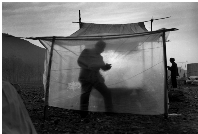
大棚内外 1988 河南鲁山