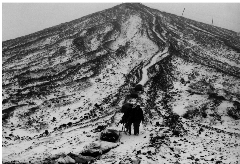
矸石山上捡煤人系列之一 1992 河南平顶山