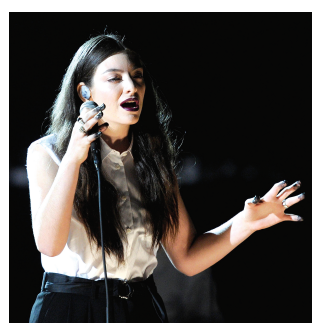
17岁的Lorde让水果姐成了“专业陪跑户”。

Katy Perry化身女巫,在电闪雷鸣的阴森布景下,演唱《Dark House》。Katy褪掉长袍后,露出了十字架造型的红色荧光胸衣,还在焰火中秀上一段钢管舞。