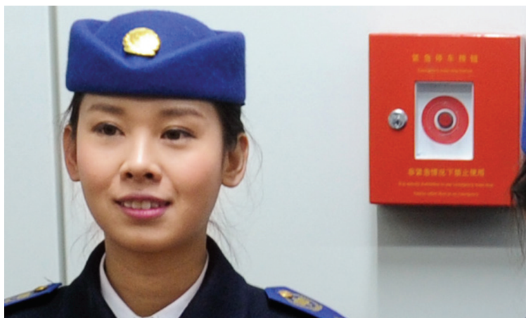
地铁站台的紧急制动按钮与成年女性的头部基本同高。