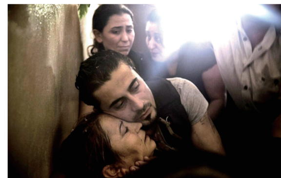
日常生活类二等奖单幅《士兵的葬礼》:叙利亚拉塔基亚,一个小镇正在为一个儿子的去世默哀。