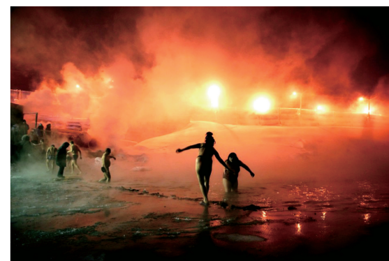
日常生活类组照三等奖《黑夜的白昼,白昼的黑夜》。