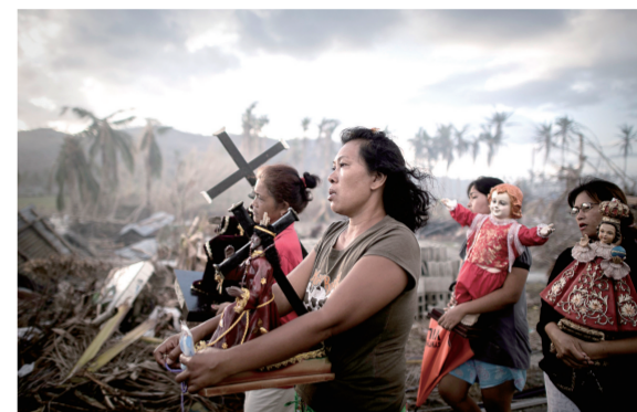
法国摄影师菲利普·洛佩于2013年11月18日在菲律宾托洛萨拍摄的《台风幸存者》获得突发新闻类单幅一等奖。

荷赛入选评审最后阶段作品的摄影师必须要提供原片,供PS专家进行审核。在进入评审的最后一轮前,评委们会拿到PS专家对每张照片的PS评估报告。只要专家们认为照片的真实性上存在异常情况,获奖作品就有可能被取消资格。