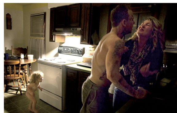
当代热点组照一等奖《家暴》,Maggie与孩子父亲分手后与Shane展开了恋情。因为经济和感情危机,她遭遇了家暴。