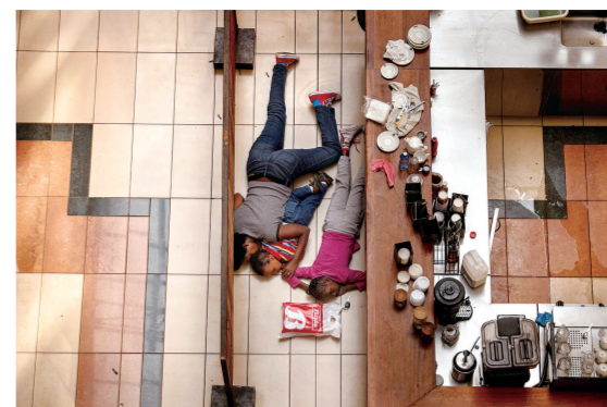
突发类新闻组照二等奖,2013年9月21日,Tyler Hicks 拍摄到内罗毕一家高档购物中心发生恐怖袭击案。