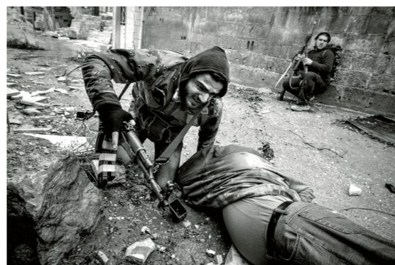
突发新闻类组照一等奖,塞尔维亚摄影师 Goran Tomasevic 拍摄的《叙利亚自由军袭击检查站》。