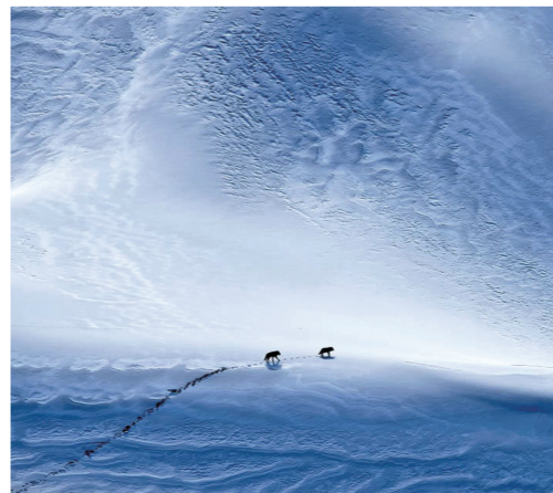
中国摄影师樊尚珍的《荒原上的狼》,获自然类单幅三等奖。