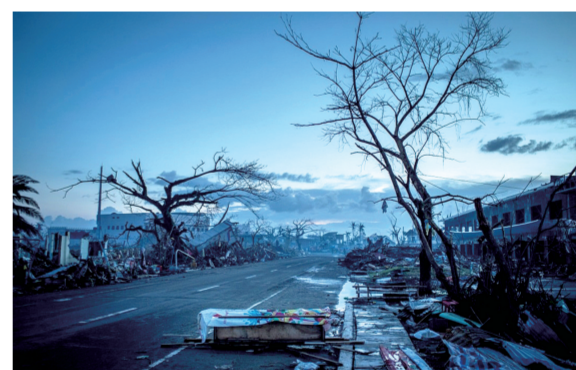
一般新闻类获奖组照一等奖《台风海燕》

荷赛奖由总部设在荷兰的世界新闻摄影基金会主办。该会成立于1955年,自1957年举办第一届世界新闻摄影比赛以来,至2014年已举办了57届。主办者强调并鼓励摄影记者深入现场、不畏艰险的采访作风,倡导有创造性的、形象感染力强的表现手法。