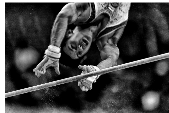
中国摄影师雷国荣组照《杠上竞争》,获体育动作类一等奖。