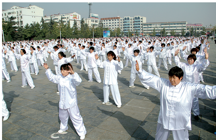
常年举行的健身气功大赛引领全民健身新风尚

本报讯 “弧度大点,再用点力,进啦……”新春伊始,荥阳市体育中心篮球场举行的“我是神投手”3分投篮比赛吸引了众多过往市民驻足观看。