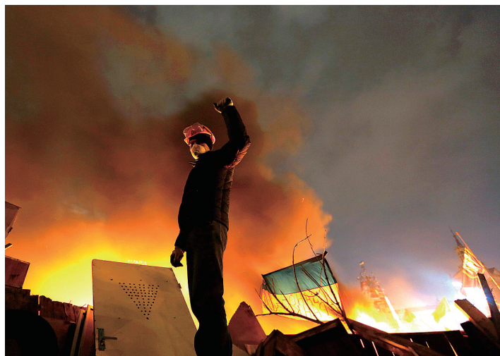
在乌克兰首都基辅独立广场,一名示威者在与警察的冲突中握紧拳头。